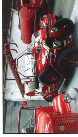
Autopompe LAFFLY dite ROSALIE 1927